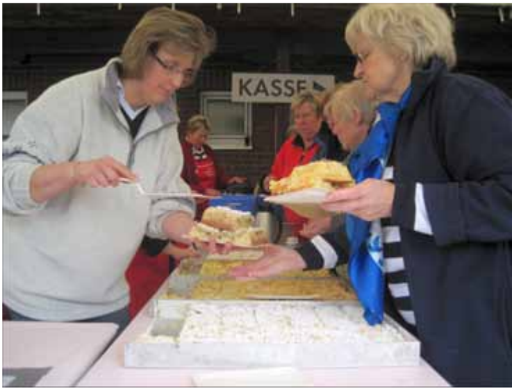
Fleißige Hände am Hausgroawefest