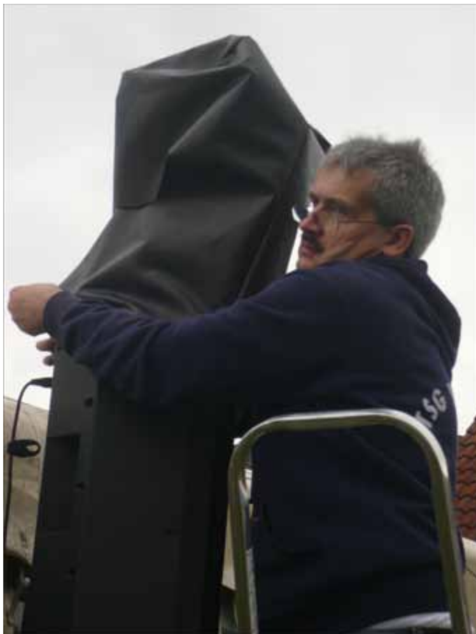
Hier hilft der TSG-Vorsitzende persönlich