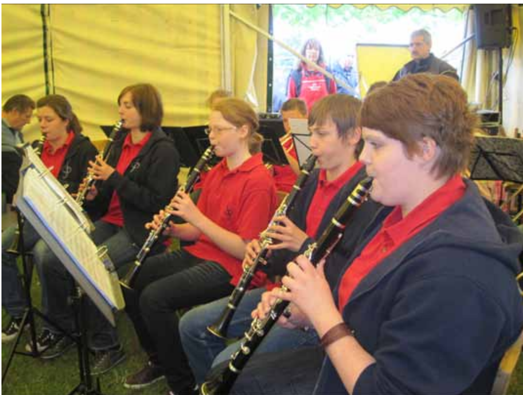
Die Jugend der Abteilung Spielmannszug/ Blasmusik stellte beim Hausgroawefest ihr Können unter Beweis

Mainzer Landstraße 659 · 65934 Frankfurt Main Telefon 069 / 395670 · Fax 069 / 393713